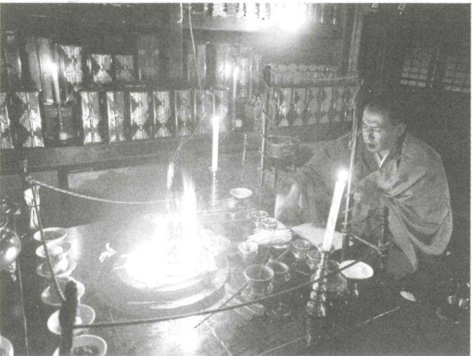
護摩の修法の様子